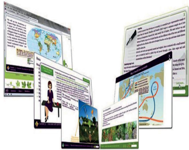
Figure 1. Aperçu des supports pédagogiques du projet.